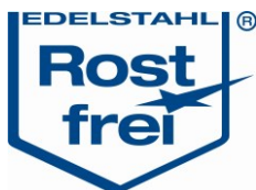
Legierungszuschläge Bleche in €/kg