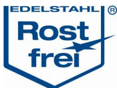
Legierungszuschläge Bleche in €/kg